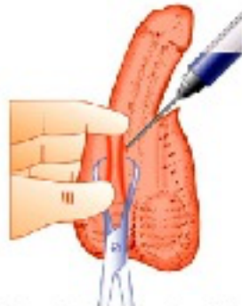
Vas injected with anesthetic