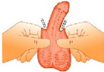
Simultaneous identification of each vas deferens